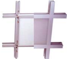
7. CamGrid SM 20