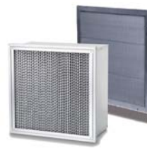
4. Airopac HT/Opakoven HT